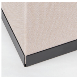
Bac en acier laqué noir