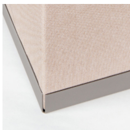
Bac en acier laqué gris