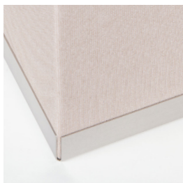
Bac en acier inoxydable brossé