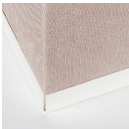
Bac en acier laqué blanc